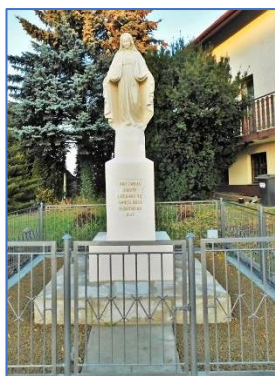
Kamienna kapliczka z figurą Matki Boskiej w Zagórzycach 2020 rok