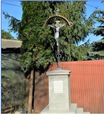
Krzyż metalowy z figurą Jezusa w Wilczkowicach 2021 rok

- prace konserwatorskie krzyża drewnianego w Kozierowie.