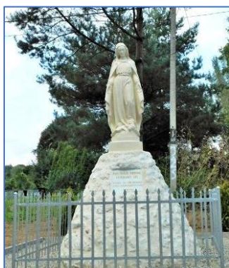
Kamienna kapliczka z figurą Matki Boskiej w Woli Więctawskiej 2019 rok

Koszt zadania: 6 000,00 zł (środki z funduszu sołectkiego)