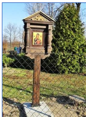
Drewniana kapliczka Matki Boskiej w Książniczkach 2019 rok

- prace konserwatorskie kamiennej kapliczki Matki Boskiej w Woli Więctawskiej;